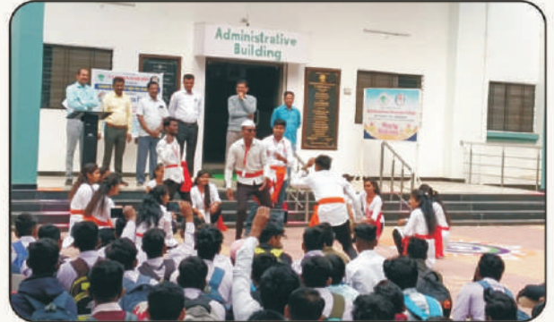
मतदार दिन जागृती पथनाट्य सादर करताना विद्यार्थी