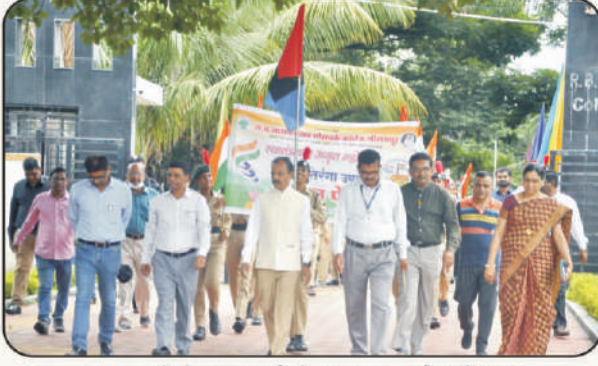
'हर घर तिरंगा' प्रभातफेरीत मा, प्राचार्य व शिक्षक