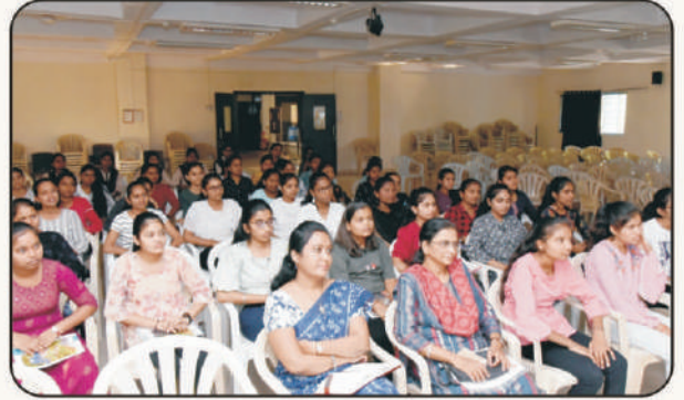
उपस्थित महिला सेवक व विद्यार्थिनी