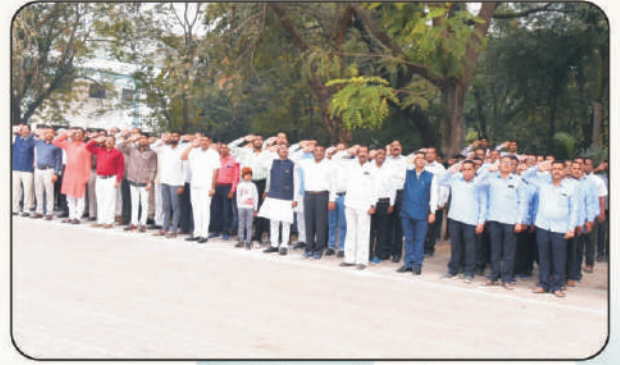
प्रजासत्ताक दिनानिमित्त उपस्थित शिक्षक वर्ग