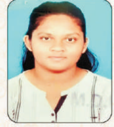
कदम अंजली बाबासाहेब

अखिल भारतीय कबड्डी स्पर्धेसाठी सावित्रीबाई फुले पुणे विद्यापीठ संघात निवड व अश्वमेध राज्य क्रीडा महोत्सवात ब्रॉन्झ मेडल प्राप्त