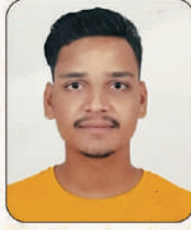
आव्हाड सार्थक आनंदा

भारतीय रोलबॉल संघात निवड, ६व्या आंतरराष्ट्रीय रोलबॉल वर्ल्डकप स्पर्धेत सिल्व्हर मेडल व अखिल भारतीय विद्यापीठ रोलबॉल स्पर्धेत सुवर्णपदक प्राप्त