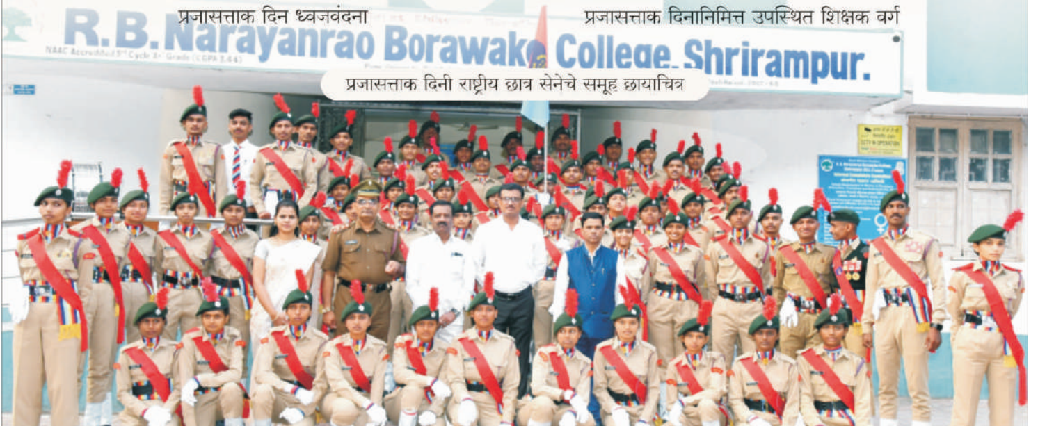
प्रजासत्ताक दिनी राष्ट्रीय छात्र सेनेचे समूह छायाचित्र