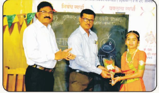
सांस्कृतिक उपक्रम सहभागाबद्दल विद्यार्थिनीचा सत्कार