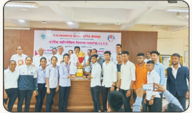
अॅथलेटिक्स चॅम्पियनशिपचा करंडक स्वीकारताना विजयी संघ