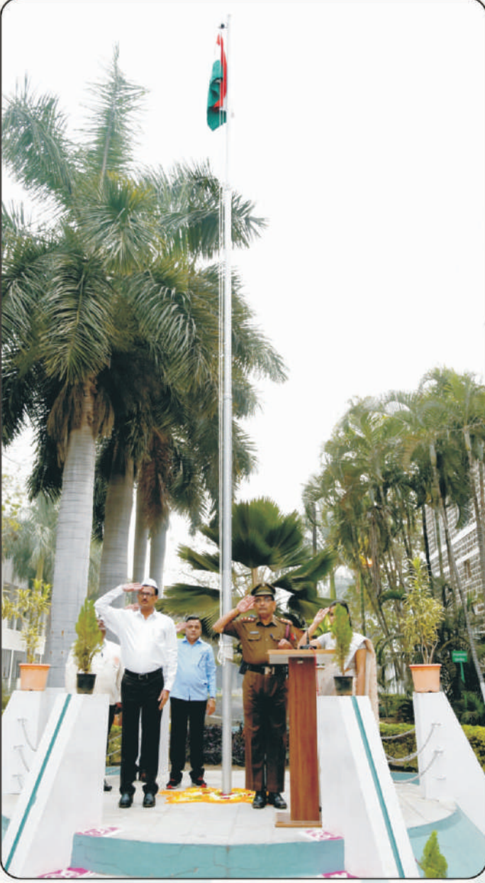
प्रजासत्ताक दिन ध्वजवंदना