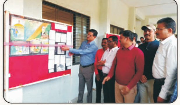
संविधान दिनानिमित्त भित्तिपत्रक प्रकाशन