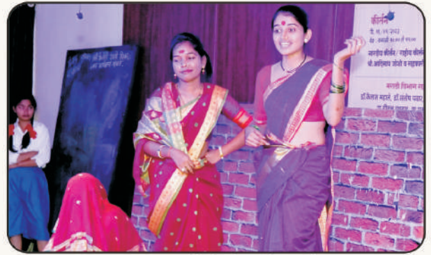
'दळण' एकांकिकेतील शेजारणी