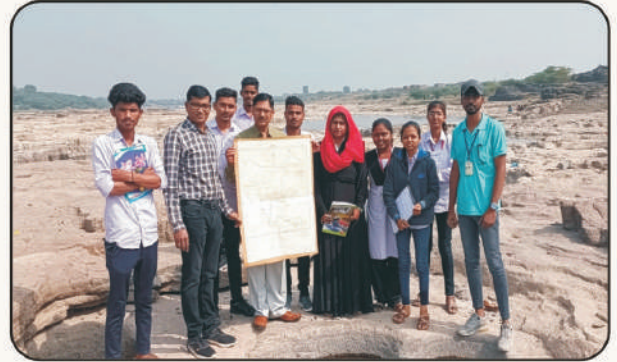
पुणतांबा गोदावरी नदीपात्रातील रंजण खळग्यांचा अभ्यास.