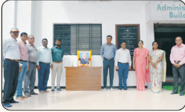
भारतरत्न डॉ. ए.पी.जे. अब्दुल कलाम यांच्या प्रतिमेचे पूजन करताना मान्यवर