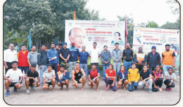
मॅरेथॉन विजयी स्पर्धकांसमवेत मान्यवर पाहुणे