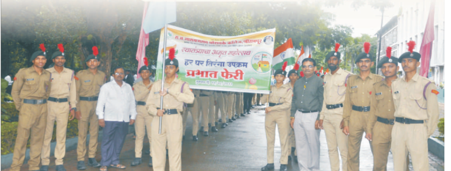
'हर घर तिरंगा' प्रभातफेरीतील प्रस्थान दृश्य