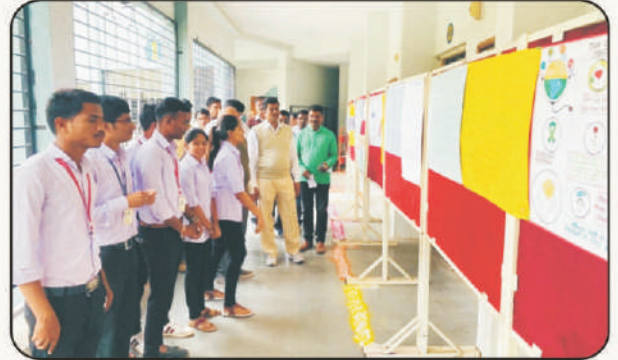
मा. खासदार शरदचंद्रजी पवार साहेब यांच्या वाढदिवसानिमित्त पोस्टर प्रेझेंटेशन