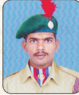
प्रसाद बाबासाहेब भांड आर्मी अटॅचमेंट कॅम्प, अ.नगर