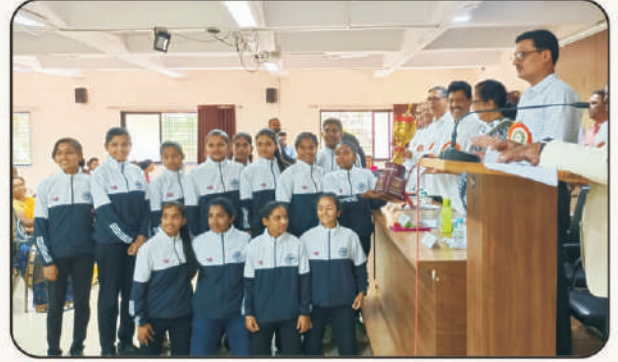
कबड्डी संघाचे कौतुक करतांना प्रमुख पाहुणे आणि इतर मान्यवर