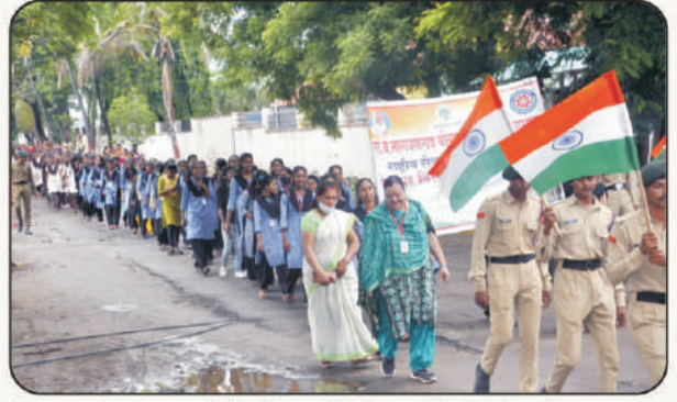
'हर घर तिरंगा' प्रभातफेरीत रा.से.यो. विद्यार्थी