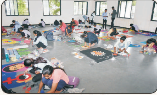
रांगोळी काढतांना विद्यार्थिनी