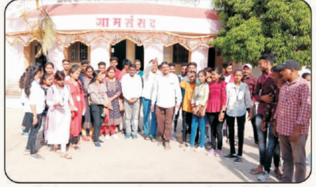
हिवरेबाजार महाराष्ट्रातील एक आदर्श गाव येथे भेट