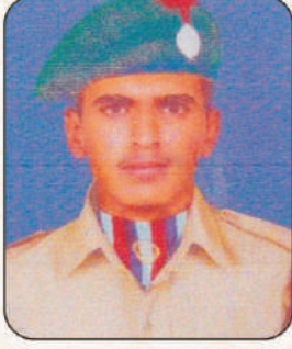
ऋषिकेश एकनाथ हांडे बेसिक लिडरशिप कॅम्प, गुजरात