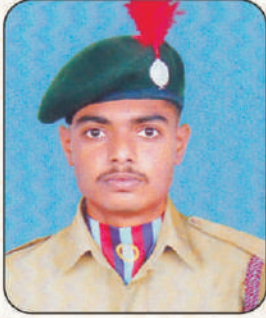
देविदास अण्णासाहेब देशमुख आर्मी अटॅचमेंट कॅम्प, अ.नगर