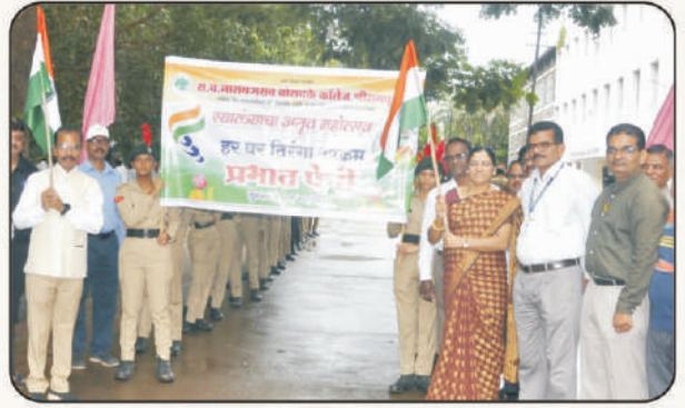
'हर घर तिरंगा' प्रभातफेरीत मा, प्राचार्य, शिक्षक व विद्यार्थी