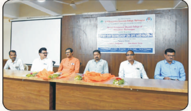
मंचावर विराजमान कार्यशाळेचे प्रमुख पाहुणे व इतर मान्यवर