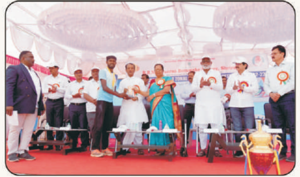
विजेत्या खेळाडूंचा सत्कार करतांना मान्यवर