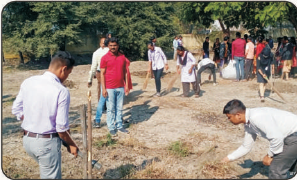
शिबीर स्थळी स्वच्छता करतांना स्वयंसेवक व कार्यक्रम अधिकारी