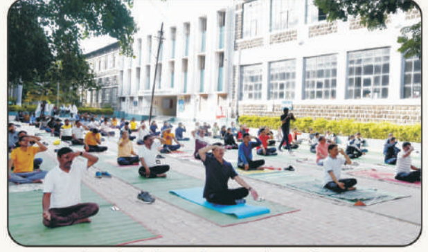
जागतिक योगदिनी प्रात्यक्षिक करतांना महाविद्यालयीन सेवक वर्ग