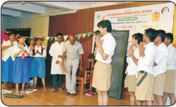
'दळण' एकांकिका एक दृश्य