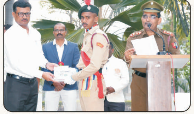
शिबीर यशस्वी छात्रसैनिकाचा सत्कार