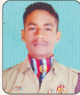
ऋषिकेश सुभाष चव्हाण आर्मी ट्रेनिंग स्कूल, महाराष्ट्र