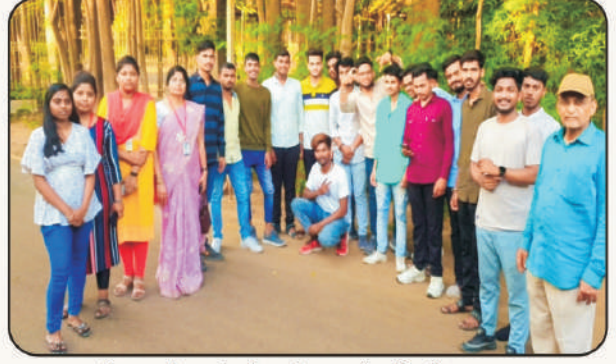
इतिहास विभागांतर्गत कोकणदर्शन शैक्षणिक सहल