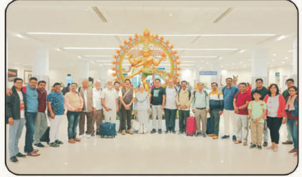
केलानिया विद्यापीठ, कोलंबो, श्रीलंका आंतरराष्ट्रीय चर्चासत्रास उपस्थिती