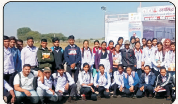
स्वयंसिद्धा प्रशिक्षण वर्गास उपस्थिती