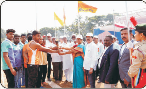
क्रीडाज्योत विद्यार्थ्यांकडे हस्तांतरित करतांना मान्यवर पाहुणे