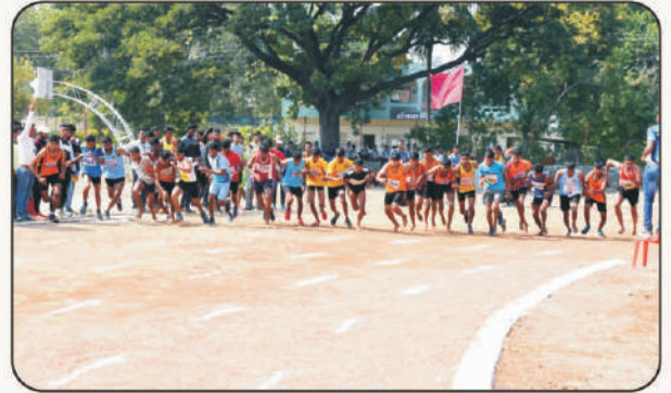
धावण्याच्या स्पर्धेतील क्षणचित्रे