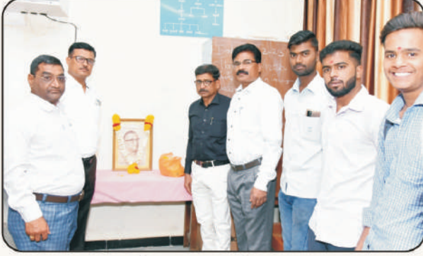
कवी कुसुमाग्रज प्रतिमापूजन

व्याख्यान (विषय : कवी कुसुमाग्रज जीवन व कार्य) दि. २७/०२/२०२३