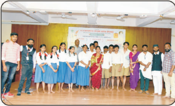
'दळण' एकांकिका कलाकार