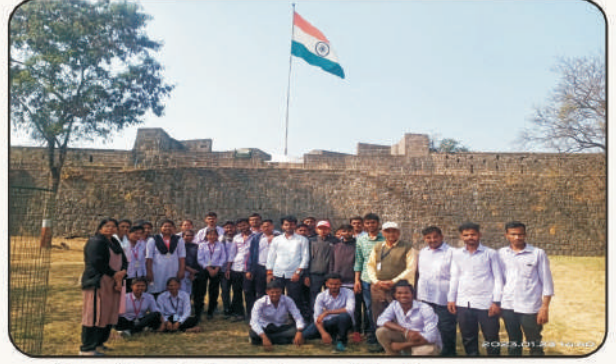
इतिहास विभागांतर्गत क्षेत्र भेट - भूर्डकोट किल्ला अहमदनगर