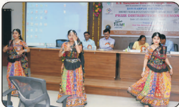
पारितोषिक वितरणप्रसंगी विद्यार्थिनींचे नृत्य सादरीकरण

या फिल्म फेस्टिव्हलमध्ये सामाजिक व शैक्षणिक विषयांवर लघुपट व माहितीपट विभागात ११३ संघांनी आपला सहभाग नोंदविला.