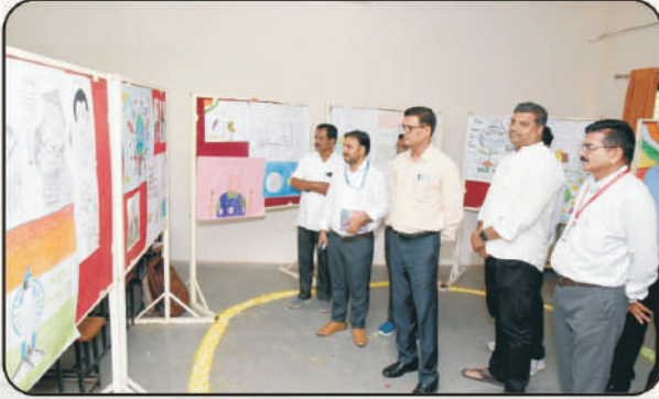
हिंदी भित्तिपत्रक अवलोकन करतांना मान्यवर