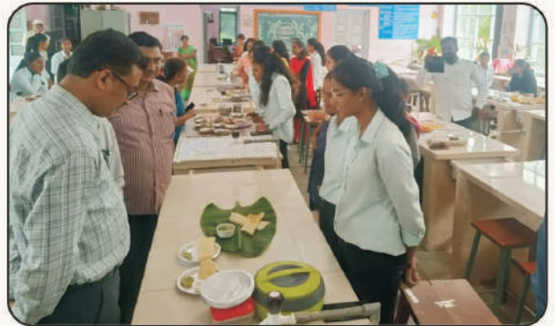
भरडधान्यापासून बनविलेल्या विविध पाककृतींचे प्रदर्शन