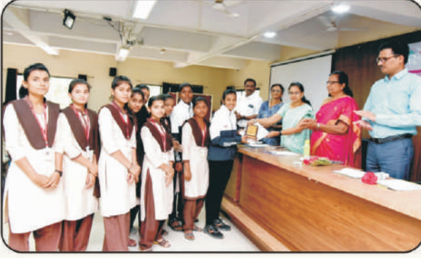
विविध यशस्वी विद्यार्थिनींचा सत्कार