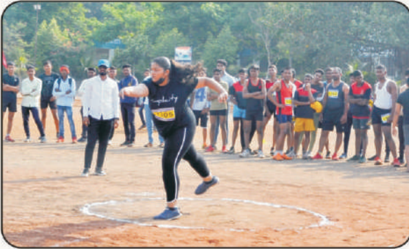
गोळाफेक करतांना स्पर्धक विद्यार्थिनी