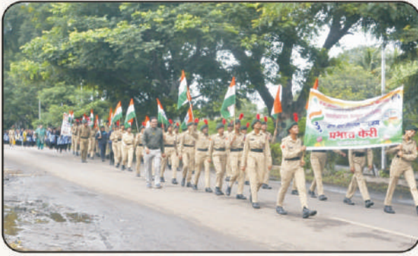
राष्ट्रीय छात्र सैनिकांची 'हर घर तिरंगा' प्रभातफेरी