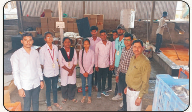
निमगाव खैरी येथील गूळ प्रक्रिया उद्योगाची माहिती घेतांना विद्यार्थी