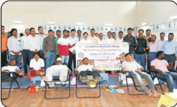
रक्तदान करताना रा.से.यो.चे विद्यार्थी