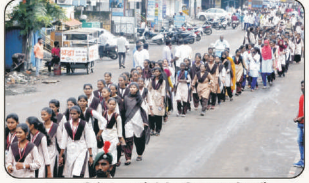
'हर घर तिरंगा' प्रभातफेरीतील शिस्तबध्द विद्यार्थी