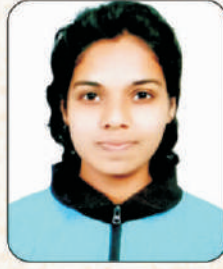
लोडे गायत्री दीपक

अखिल भारतीय बॉलबॅडमिंटन स्पर्धेसाठी सावित्रीबाई फुले पुणे विद्यापीठ संघात निवड