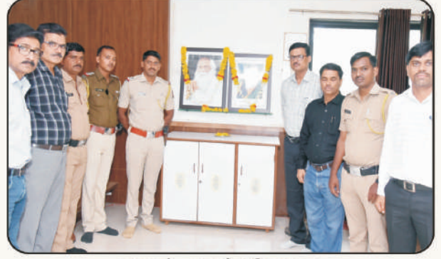
पाहुण्यांच्या हस्ते प्रतिमापूजन