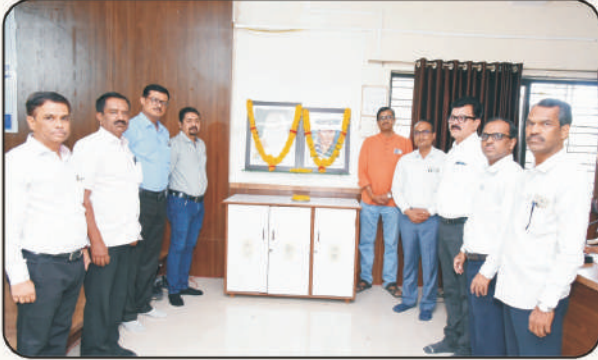
मान्यवरांच्या हस्ते प्रतिमापूजन