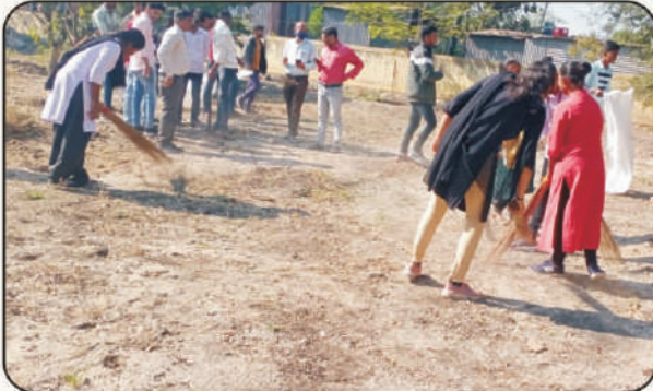
रा.स.यो. विद्यार्थी श्रमदान करतांना सोबत कार्यक्रम अधिकारी