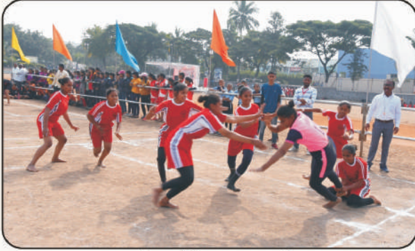
कबड्डी स्पर्धेतील एक क्षणचित्र