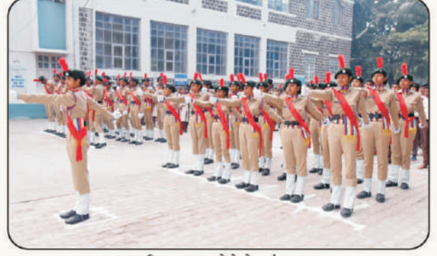
राष्ट्रीय छात्र सेनेचे संचलन