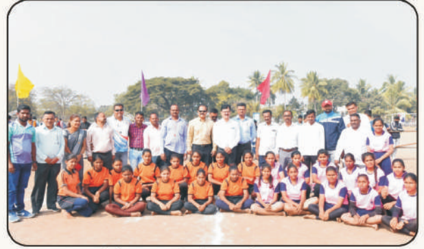
विजेता कबड्डी संघ समवेत मान्यवर