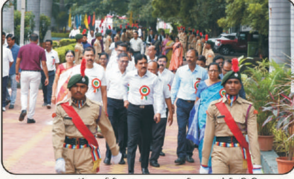
पद्मभूषण डॉ. कर्मवीर भाऊराव पाटील जयंती निमित्त पाहुण्यांचे आगमन