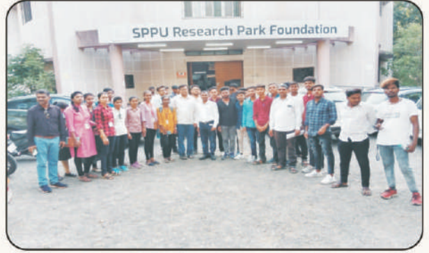
SPPU Research Park Foundation या ठिकाणी भेट