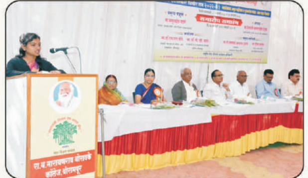
शिबीर समारोप प्रसंगी विद्यार्थिनी मनोगत व्यक्त करतांना