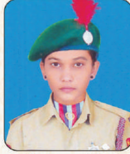
जयश्री बाळासाहेब आहरे आर्मी अटॅचमेंट कॅम्प, पुणे