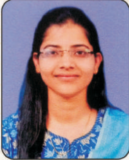
भक्ती बाबासाहेब मुठे विक्रीकर निरीक्षकपदी निवड