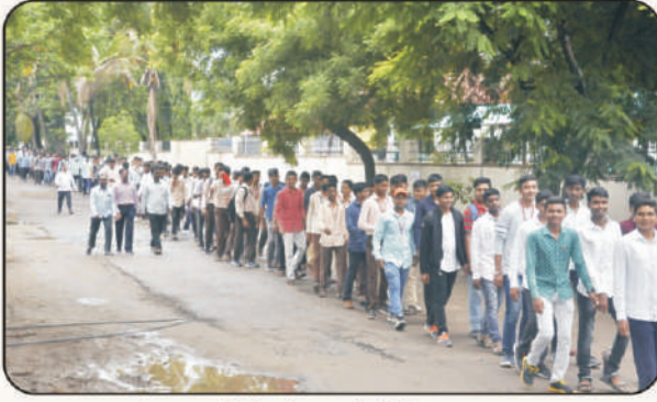
'हर घर तिरंगा' प्रभातफेरीतील एक दृश्य