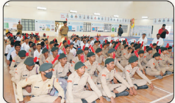
उपस्थित राष्ट्र छात्र सैनिक