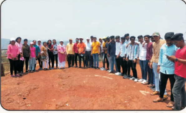
इतिहास विभागांतर्गत शैक्षणिक सहल - कोकण दर्शन