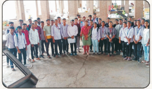
कृषी उत्पन्न बाजार समितीची माहिती घेतांना अर्थशास्त्र विभाग विद्यार्थी

लघुपट निर्मिती कार्यशाळेस उपस्थित विद्यार्थी