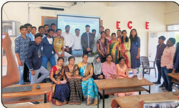
पदवी, पदव्युत्तर वर्ग प्रथम वर्ष स्वागत समारंभ